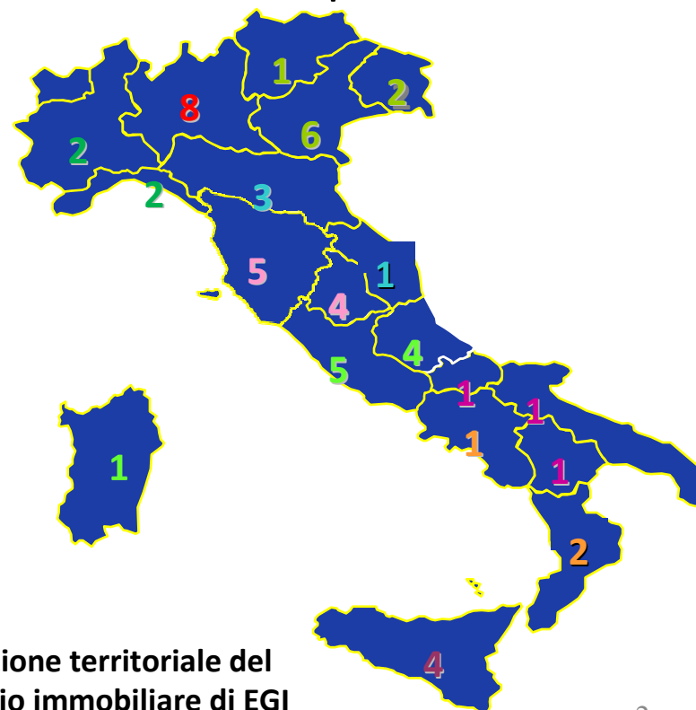
Dislocazione territoriale del portafoglio immobiliare di EGI